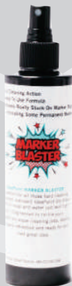
商品番号：G-021 ハイパークリーナー 236ml

G-006 純正消去用イレイサーとの併用で、洗浄効果が倍増します。 洗浄後は、G-004 純正クロスで余分な液や汚れを拭き取りましょう。